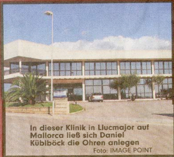
In dieser Klinik in Llucmajor auf Mallorca ließ sich Daniel Küblböck die Ohren anlegen